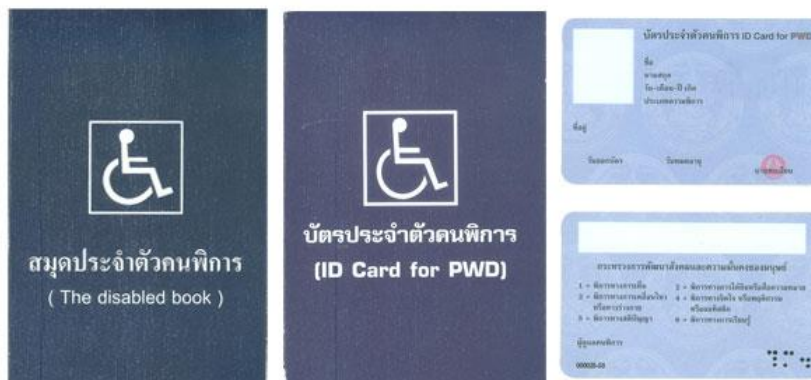
ตัวอย่างบัตรและสมุดประจำตัวคนพิการ

กรณีได้รับเบี้ยยังชีพคนพิการอยู่แล้วและได้ย้ายเข้ามาในพื้นที่องค์การบริหารส่วนตำบลโคกพระ จะต้องมาขึ้นทะเบียนและยื่นคำขอรับเงินเบี้ยความพิการที่ องค์การบริหารส่วนตำบลโคกพระ และให้ได้รับเบี้ยความพิการจากองค์กรปกครองส่วนท้องถิ่นในเดือนถัดไป ทั้งนี้ต้องได้รับการยืนยันจากองค์กรปกครองส่วนท้องถิ่นเดิมที่จ่ายเงินเบี้ยความพิการเพื่อไม่ให้เกิดความซ้ำซ้อน