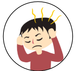
ปวดเมื่อยตาม