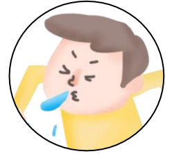
มีน้ำมูกไหล