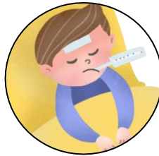
มีไข้สูง