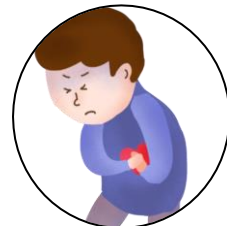
แน่นหน้าอก