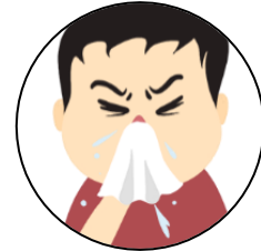
ไอ เจ็บคอ