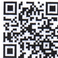
QR code website

ผู้ประสานงาน นส.ธัญญ์พิศา ทิมผลประเสริฐ 02-22918117