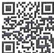
บัญชีแนบท้าย

กองส่งเสริมและพัฒนาการจัดการศึกษาท้องถิ่น ฝ่ายบริหารทั่วไป