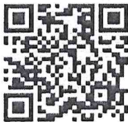
แบบประเมิน

กรมส่งเสริมการปกครองท้องถิ่น ๑๖ กรกฎาคม ๒๕๖๘