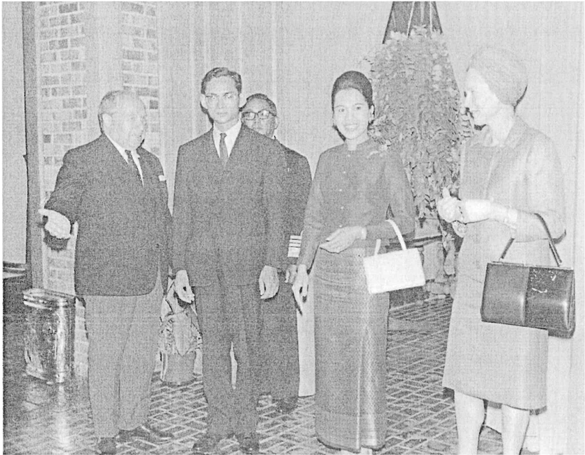
เป็นชุดไทยพิธีตอนกลางวัน ผ้าขึ้นป้ายเป็นผ้าไหมยกดอกมีเชิงหรือยกดอกทั้งตัว เสื้อแขนยาว ผ่าอก คอกลม มีขอบตั้ง