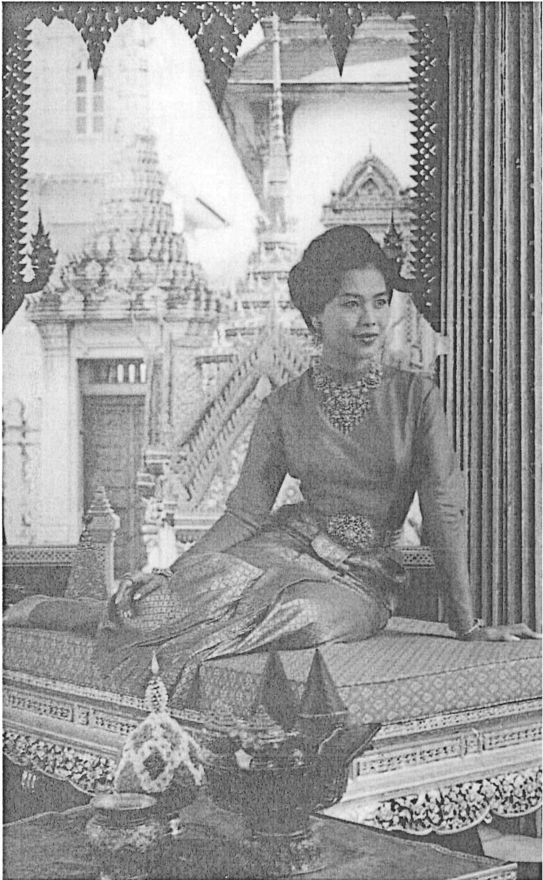
เป็นชุดไทยในงานพิธีตอนค่ำที่ใช้เข็มขัดและเครื่องประดับ ผ้าชีนยกทองทั้งตัว จีบหน้านาง เสื่อคอกกลมขอบตั่งเล็กน้อย แขนยาว และผ้าหลัง สำหรับใช้ในงานพระราชพิธีเต็มยศและประดับเครื่องราชอิสริยาภรณ์