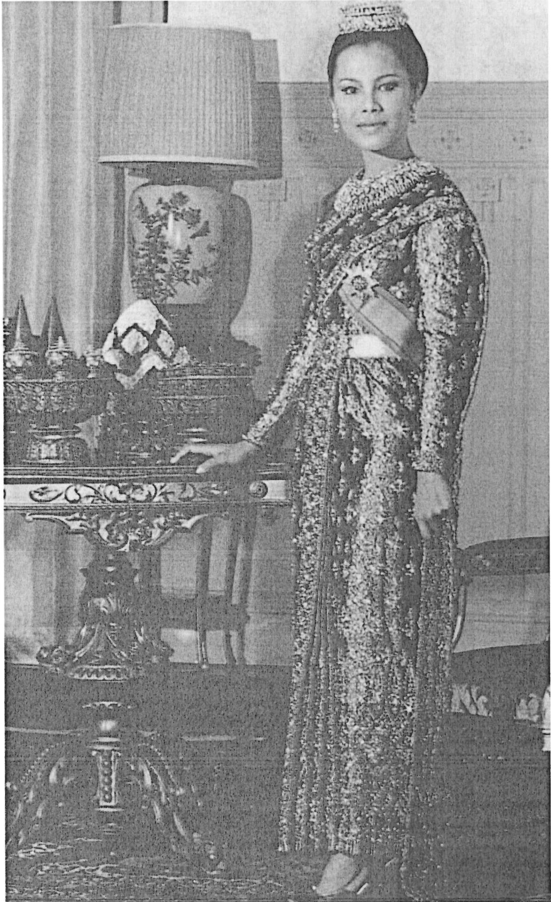
ชุดไทยแบบนี้ใช้ในงานพิธีเต็มยศ ทั้งกลางวันและกลางคืน เป็นแบบเดียวกับชุดไทยบรมพิมาน แต่มีผ้าสไบห่มทับ