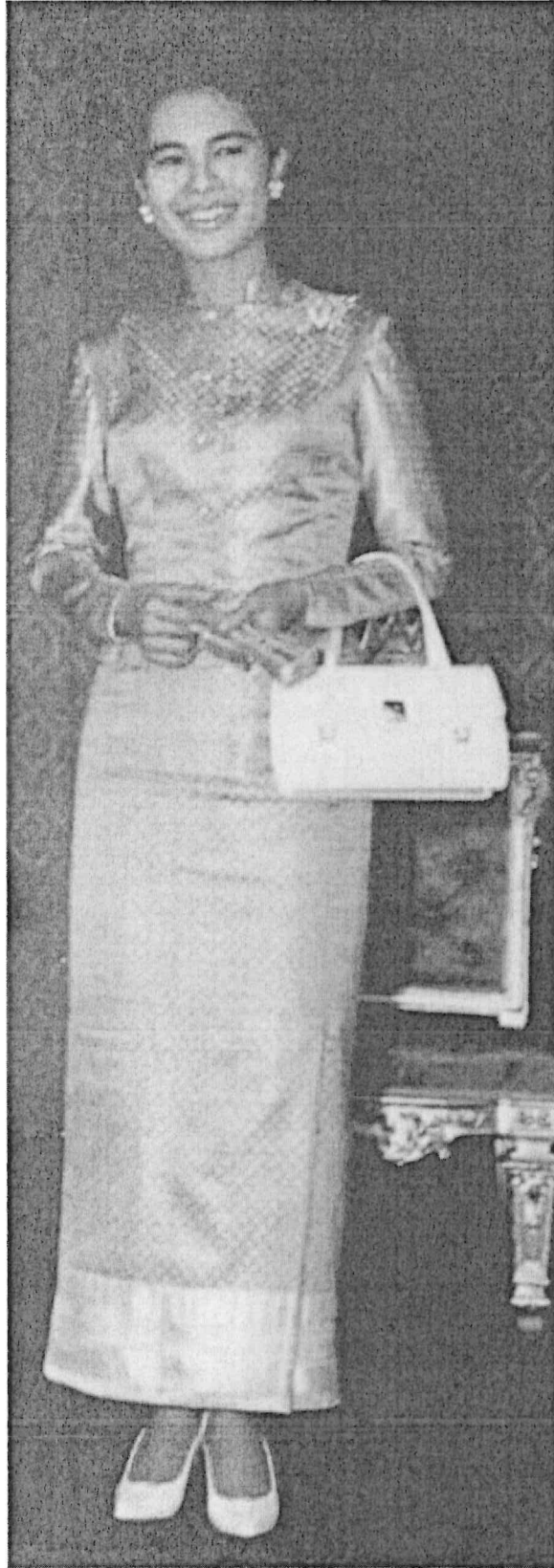
ใช้เป็นชุดพิธีตอนค่ำ ผ้าซิ่นยกทองทั้งตัว เลื้อยแขนยาว คอตั้ง เช่นเดียวกับไทยจิตรลดา