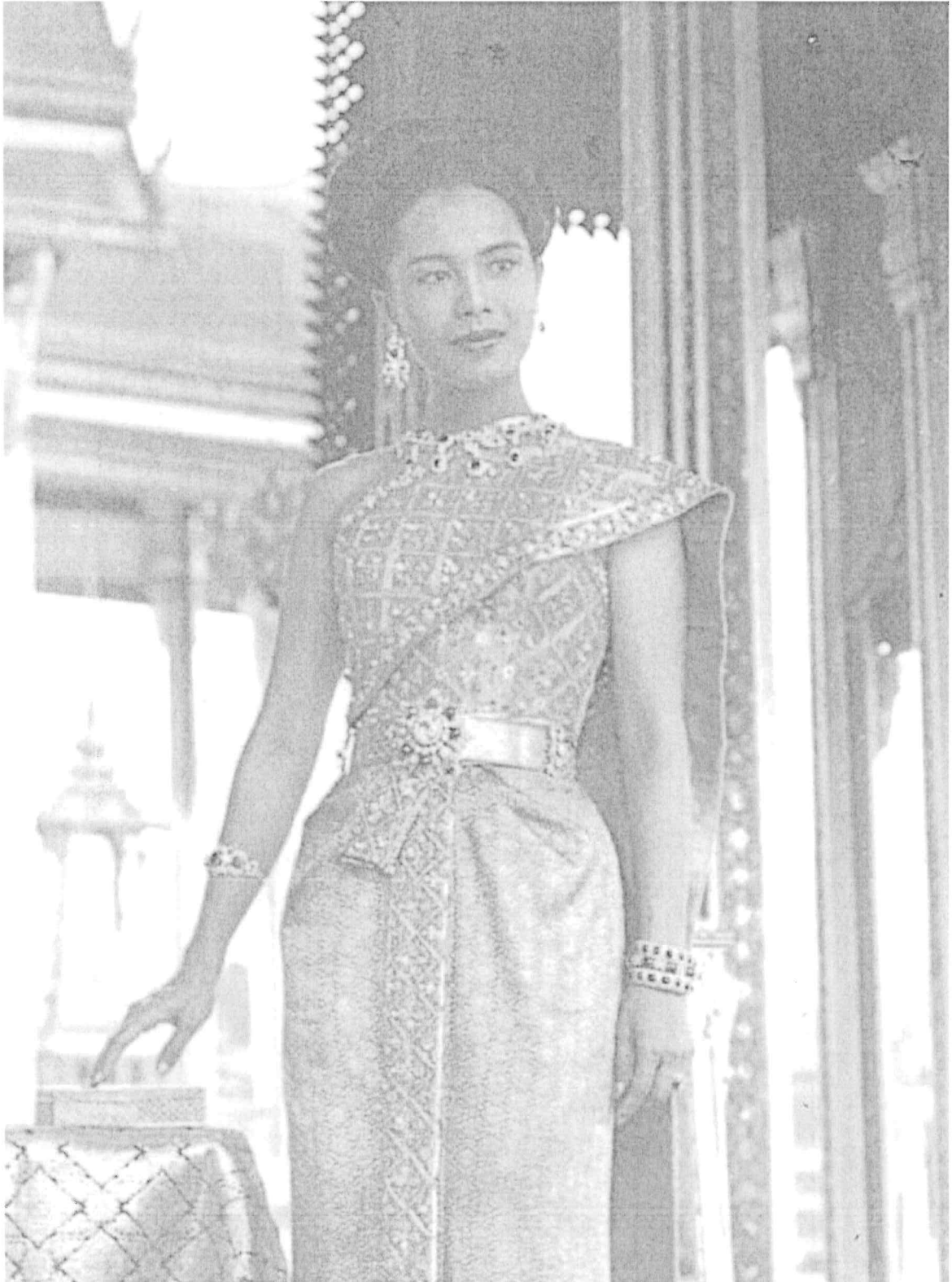
เป็นชุดที่ใช้ผ้าซิ่นแบบเดียวกับไทยบรมพิมาน แต่เสื้อเป็นสไบเฉียง ใช้ในโอกาสงานพิธีกลางคืน