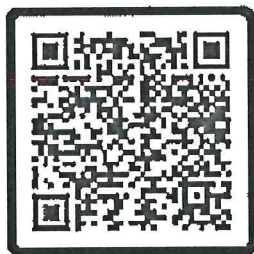
แบบตอบรับการลงทะเบียนล่วงหน้า