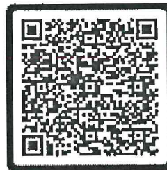
ข้อมูลการฝึกอบรม