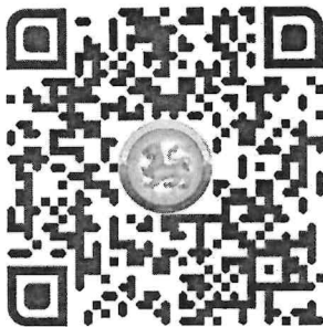
QR Code กรอกข้อมูล