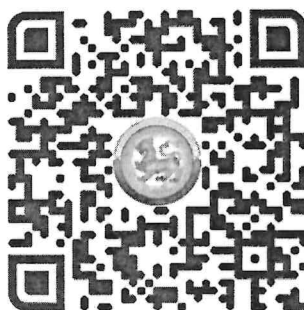
QR Code กรอกข้อมูล