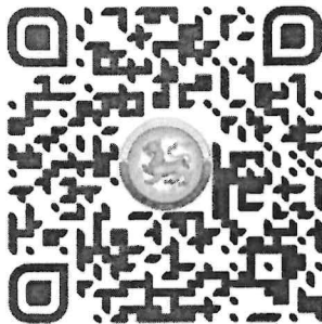
QR Code กรอกข้อมูล