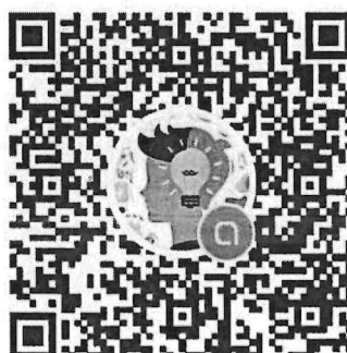
Line Openchat เพื่อการประสานงาน