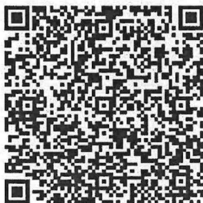
QR Code ๑ ยืนยันการเข้าร่วมอบรม