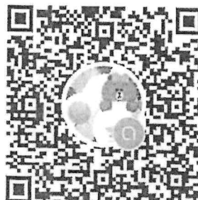
QR Code Line Openchat ๑

รายการที่ ๒ เด็กและเยาวชนที่นำชื่อเสียงมาสู่ประเทศชาติที่ผ่านเกณฑ์การคัดเลือก