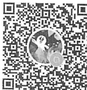
QR Code Line Openchat ๒