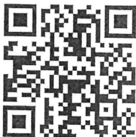
ประกาศฯ / แบบตอบรับฯ

รายการที่ ๒ เด็กและเยาวชนที่นำชื่อเสียงมาสู่ประเทศชาติที่ผ่านเกณฑ์การคัดเลือก