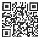
Google Form สำหรับส่งแบบฟอร์ม