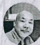
พ.ต.ท.ดร.บัณฑิต ประดิษฐ์ กรมอาชีวศึกษา สมาคมสถาปนิกสยาม ในพระบรมราชูปถัมภ์