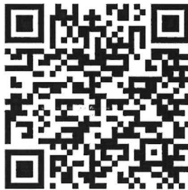
QR Code สำหรับตรวจสอบจำนวนผู้ชำระเงินค่าลงทะเบียนในแต่ละรุ่น