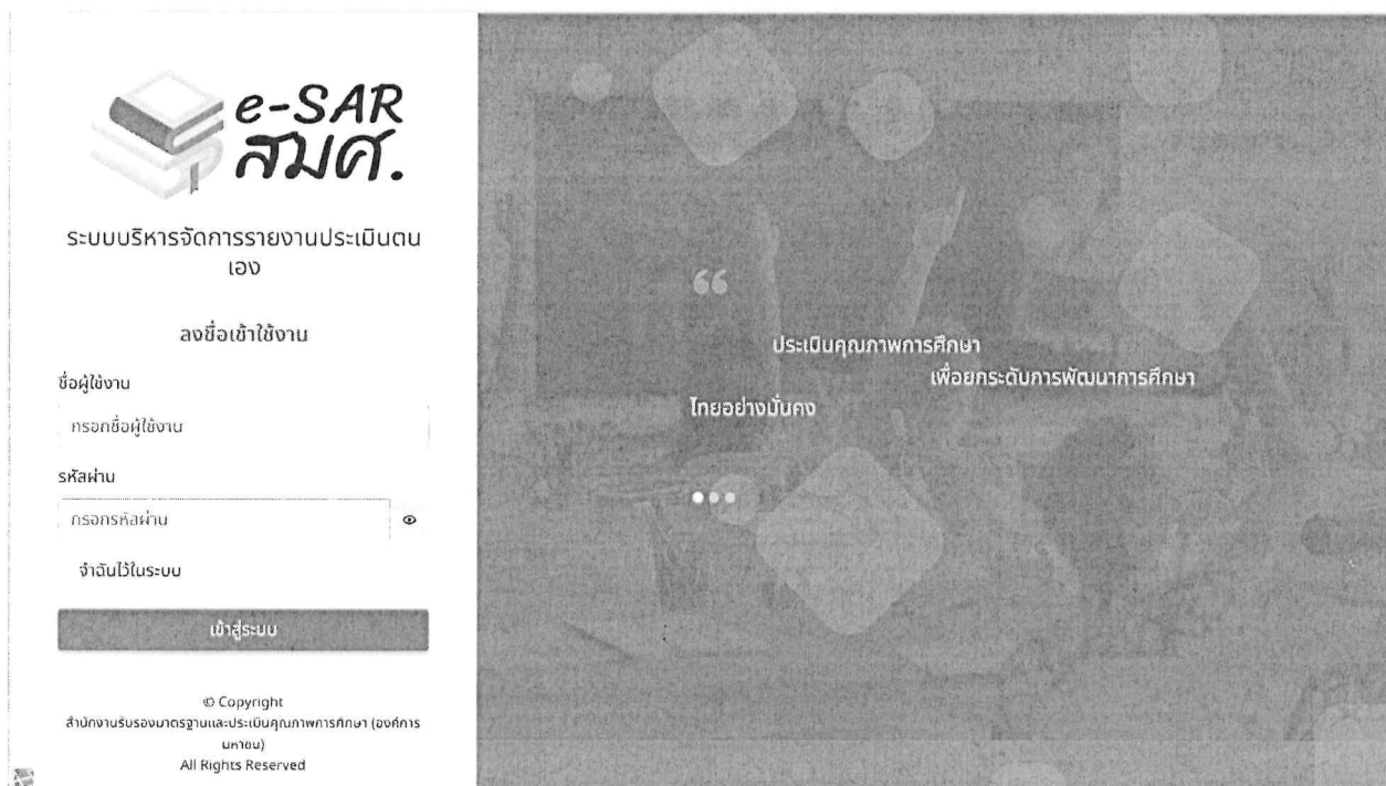
ภาพแสดง : หน้าจอ Login เข้าใช้งานระบบต้นสังกัด