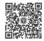
แบบคัดค้านคำขอ จดทะเบียนสิทธิ