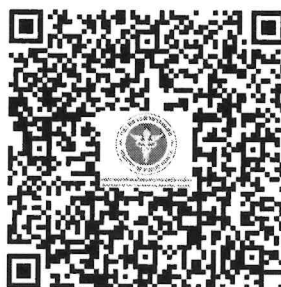
รายงานผลการดำเนินการปิดประกาศโฆษณาฯ

เมื่อท่านได้ดำเนินการปิดประกาศโฆษณาฯ ดังกล่าวข้างต้นแล้วนั้น ขอความอนุเคราะห์ท่านรายงานผลการดำเนินการปิดประกาศโฆษณาฯ ใน Google Form ที่แนบมาพร้อมนี้ ต่อไปด้วย จะเป็นพระคุณ