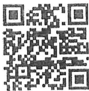
(QR Code สำหรับรายงานแผนฯ)

หมายเหตุ : ขอความร่วมมือทุกจังหวัด กรอกข้อมูลแผนการรณรงค์ประชาสัมพันธ์ในพื้นที่ผ่านระบบออนไลน์ (ตาม QR Code) ภายในวันศุกร์ที่ ๒๙ พฤษภาคม ๒๕๖๙ เพื่อเป็นข้อมูลสำหรับประชาสัมพันธ์ผ่านสื่อมวลชนในภาพรวมของประเทศต่อไป