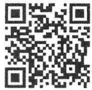
ลงทะเบียนออนไลน์

กองส่งเสริมการปกครองท้องถิ่น เลขรับ 2496 18 มิ.ย. 2569