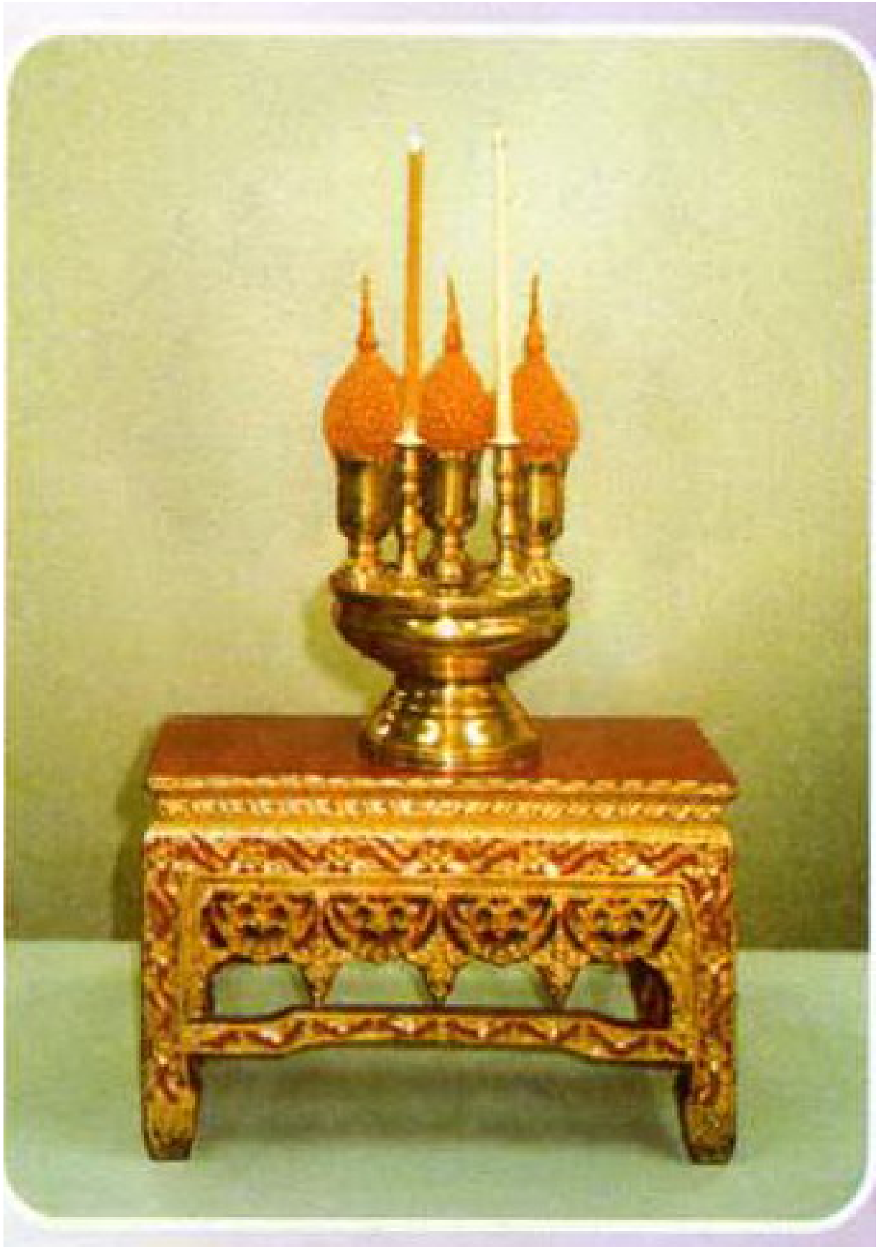
ภาพประกอบการจัดชุดเครื่องทองน้อย