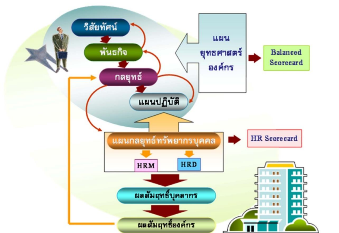
ภาพที่ ๒ ความเชื่อมโยงของผลสัมฤทธิ์ที่เกิดจากแผนกลยุทธ์การบริหารทรัพยากรบุคคลต่อผลสัมฤทธิ์ขององค์กร

จากคำกล่าวของ Dr. Robert Kaplan และ David Norton ข้างต้น สะท้อนให้เห็นว่า หากเรานำ Balanced Scorecard มาปรับใช้ในการบริหารทรัพยากรบุคคล ที่เรียกว่า HR Scorecard แล้ว จะก่อให้เกิดการพัฒนาการบริหารทรัพยากรบุคคลของส่วนราชการในภาพรวม โดยมุ่งเน้นเฉพาะปัจจัยสำคัญที่ส่งผลต่อองค์กร นอกจากนี้ยังช่วยให้วิธีการสมัยใหม่ในการบริหารทรัพยากรบุคคลทั้งหลายถูกนำมาใช้เกิดการเชื่อมโยงต่อกัน และที่สำคัญที่สุดคือ ช่วยให้บุคลากรในส่วนราชการเกิดความชัดเจนถึงเป้าหมายในงานของตนที่ส่งผลต่อความก้าวหน้าตามยุทธศาสตร์ของส่วนราชการในภาพรวม